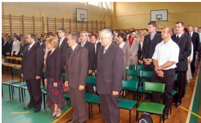
Dyrekcja i nauczyciele ZSZ

3 września o godzinie 8.00 w sali gimnastycznej w budynku szkoły przy ulicy Tuwima zabrzmiał pierwszy dzwonek w roku szkolnym 2007/2008. Uroczystą akademię rozpoczęło wprowadzenie sztandaru oraz odśpiewanie hymnu Polski.