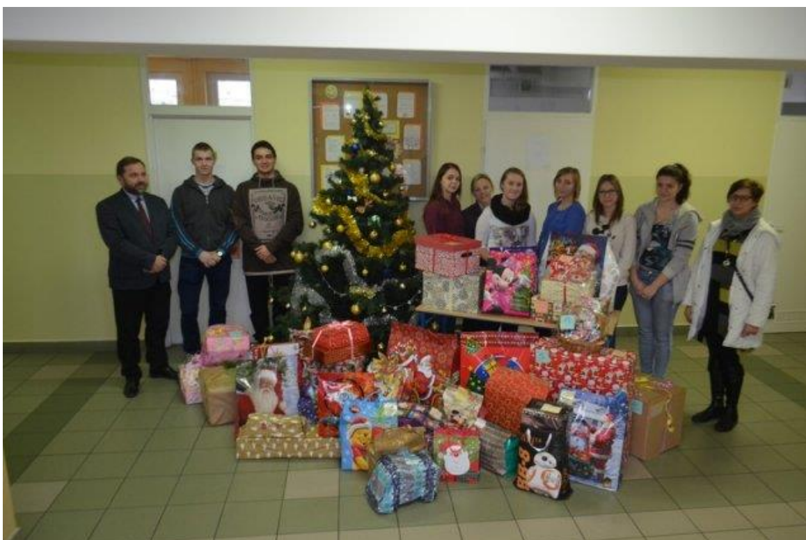
Udział w akcji „Mikołaje”