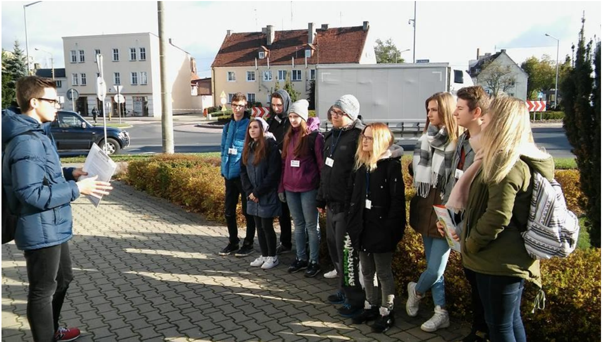
Nauka w praktyce, czyli jak być przewodnikiem wycieczki – uczniowie klasy drugiej technikum kształcącego w zawodzie technik obsługi turystycznej