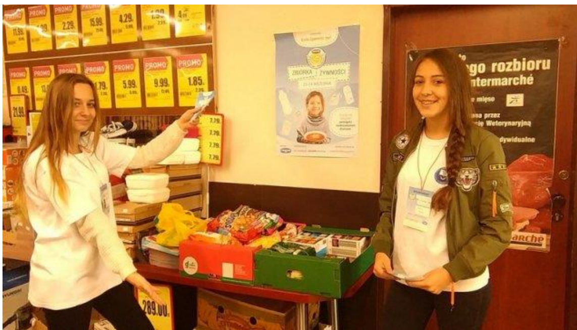
Udział w zbiórce żywności „Podziel się posiłkiem”