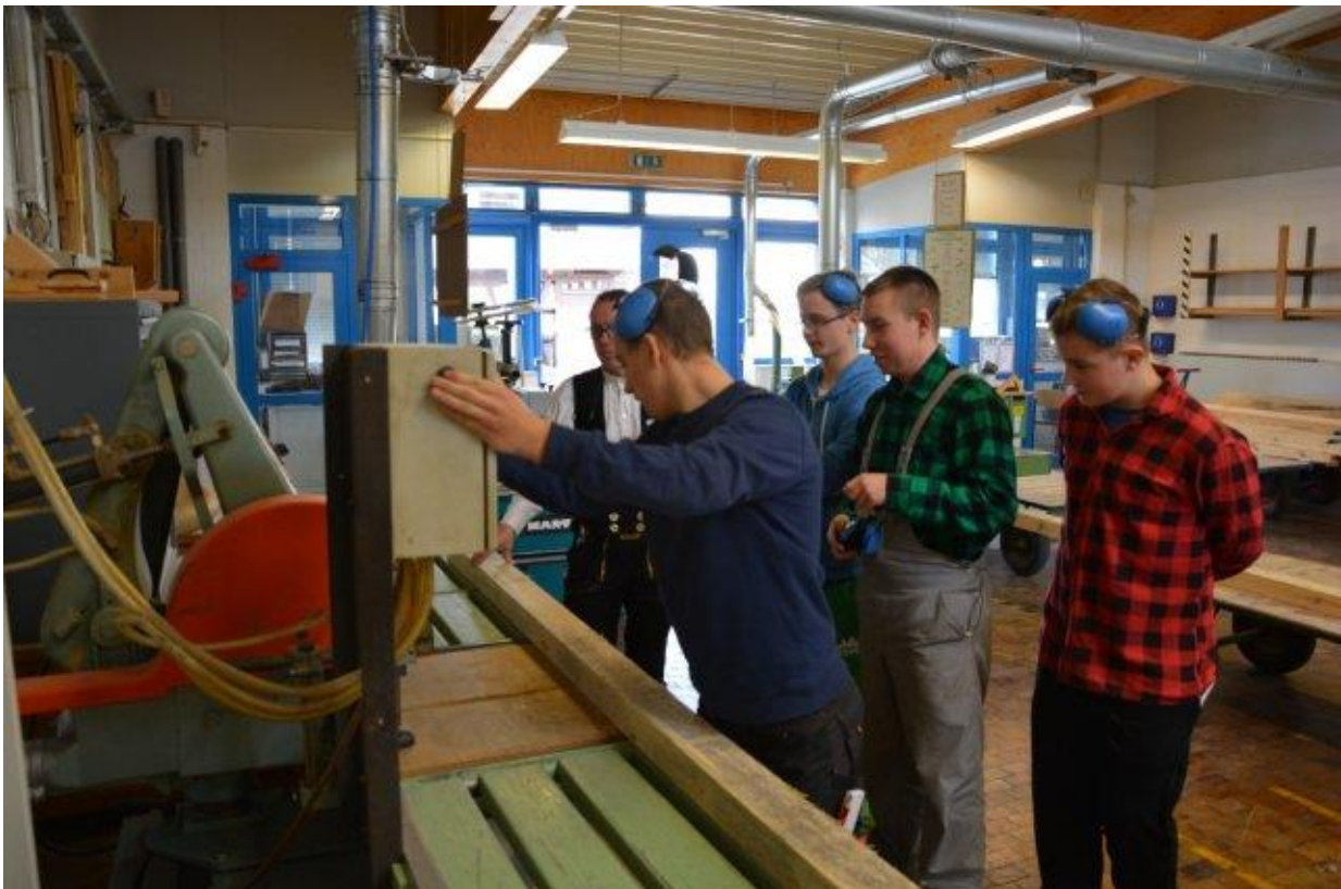
Praktyka zawodowa w Zakładzie Promowania Kształcenia Zawodowego we Frankfurcie nad Odrą – grupa stolarzy