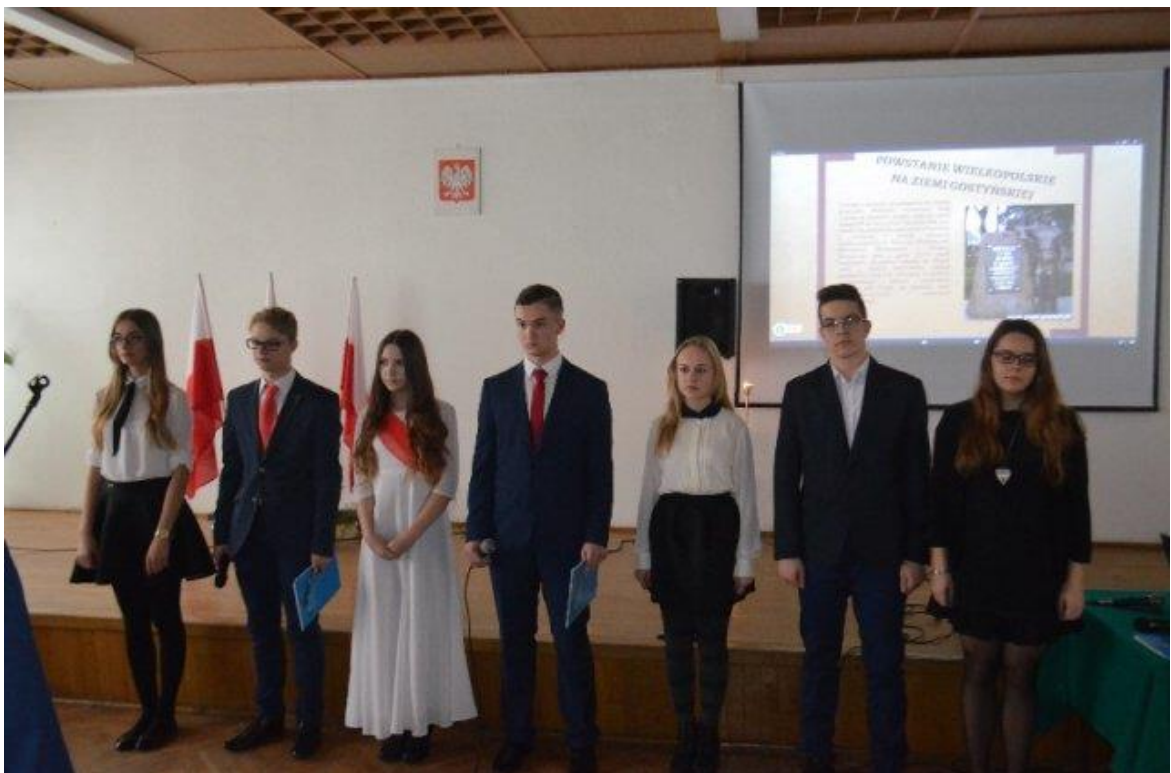
Część artystyczna obchodów 97. rocznicy wybuchu Powstania Wielkopolskiego w wykonaniu uczniów Zespołu Szkół Zawodowych w Gostyniu