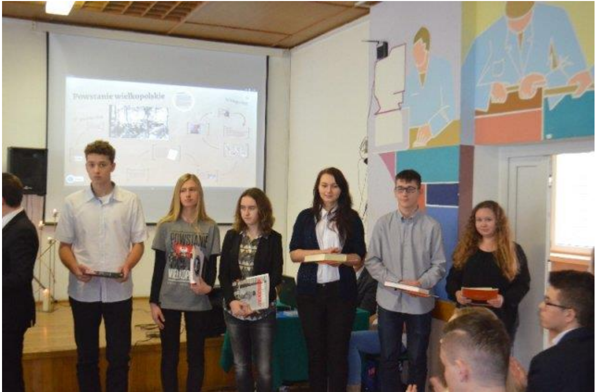
7 stycznia 2016 - Finałiści XVIII Powiatowego Konkursu Wiedzy o Powstaniu Wielkopolskim 1918 – 1919