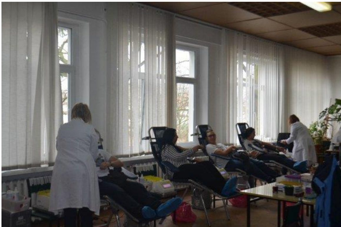
Kropla krwi darem życia – akcja pobierania krwi w ZSZ