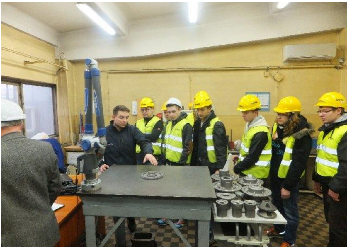
Uczniowie klasy drugiej technikum kształcącego w zawodzie technik mechatronik z wizytą w odlewni żeliwa Teriel w Gostyniu