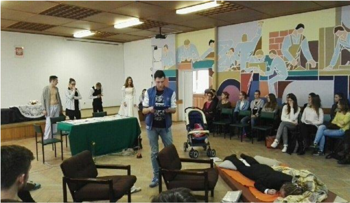
„Lekcja z Tangiem” – spektakl przygotowany przez szkolne kółko teatralne