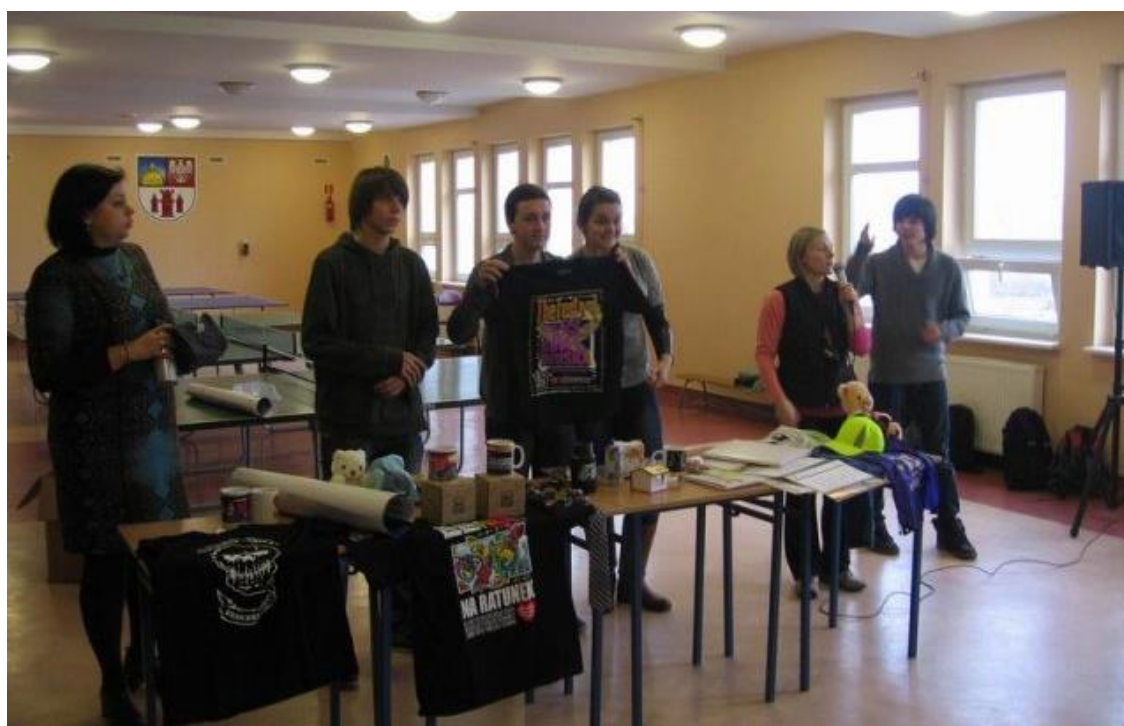
Wielka Orkiestra Świątecznej Pomocy w ZSZ