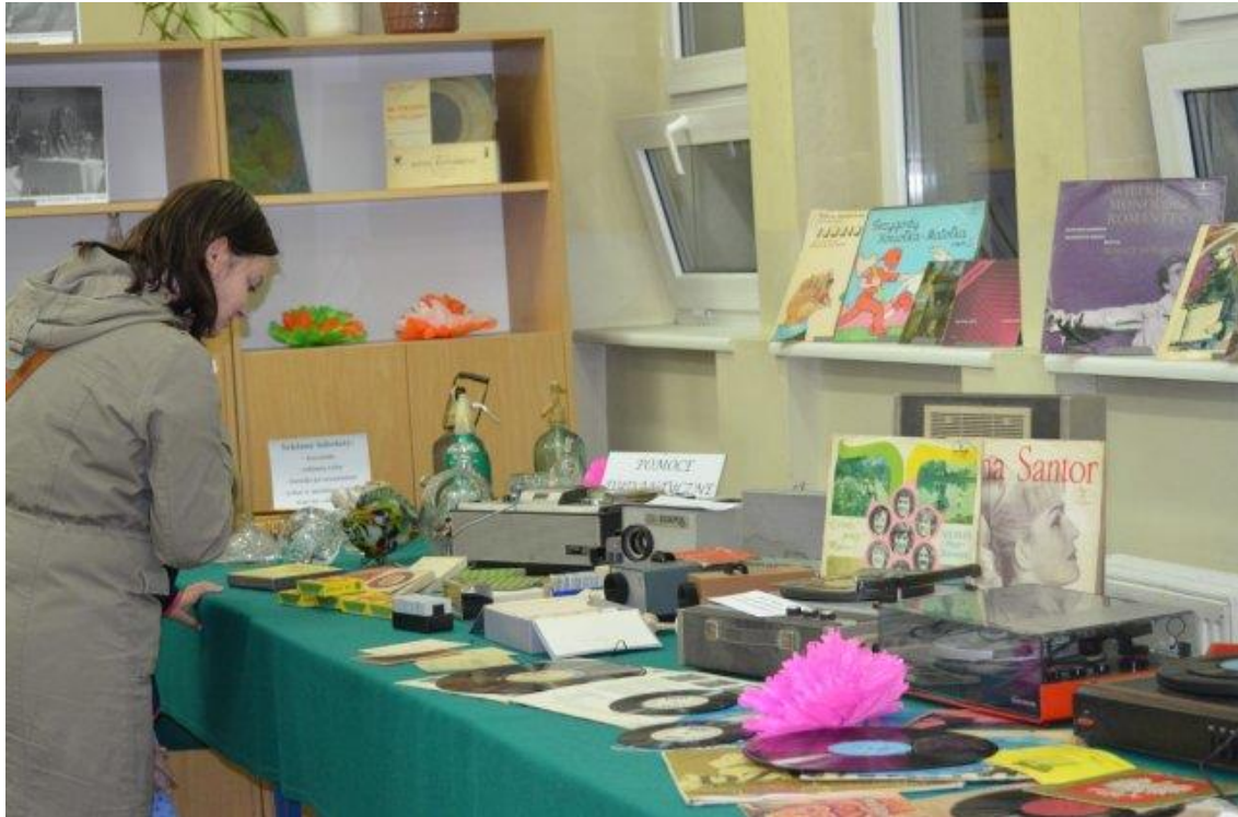
Noc z PRL-em w ZSZ