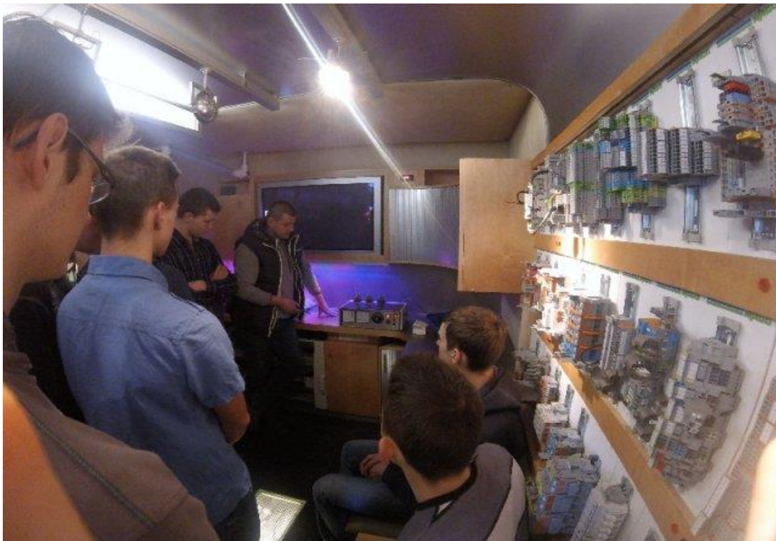
i w prezentacyjnym samochodzie firmy WAGO