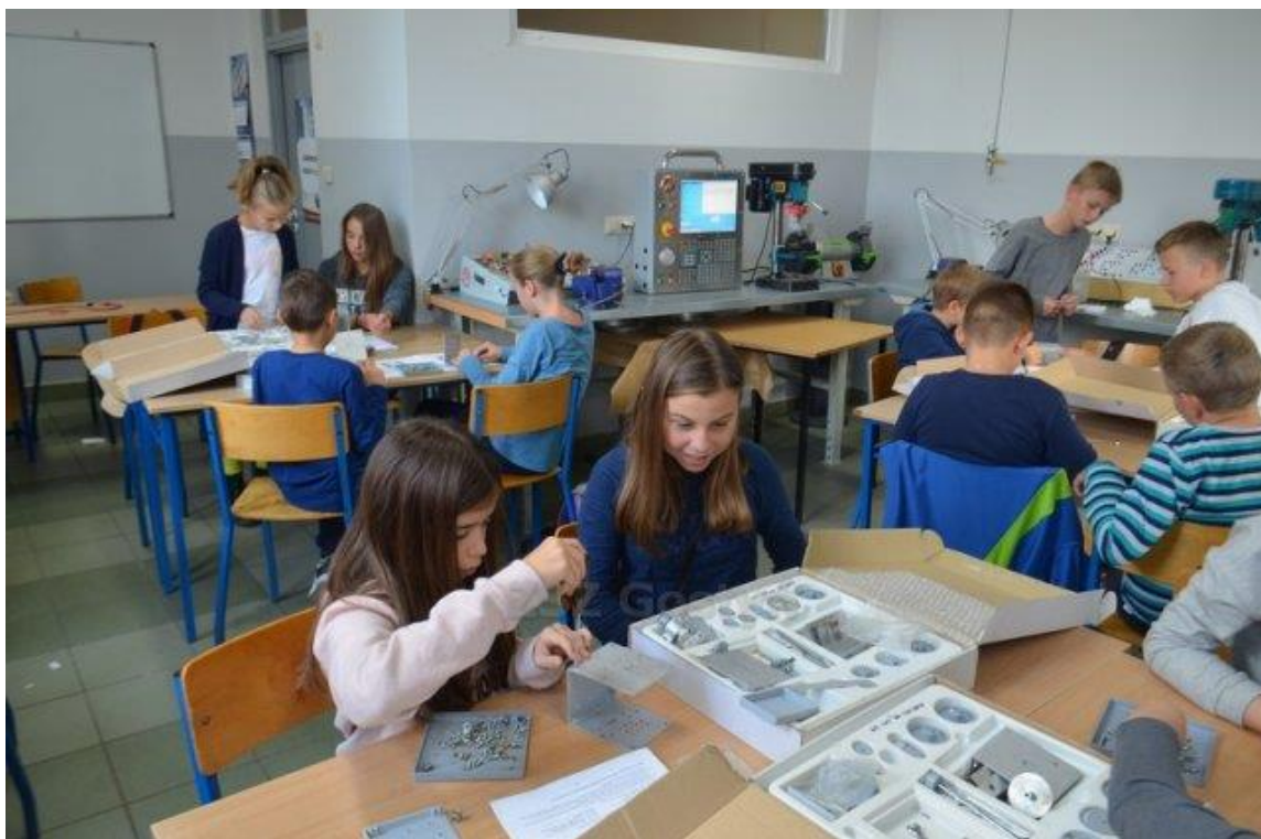
Po co ludziom roboty?" Zajęcia z mechatroniki prowadzone przez nauczycieli ZSZ w ramach Akademii Młodych Odkrywców – projektu realizowanego przez Fundację Miejsce Moje