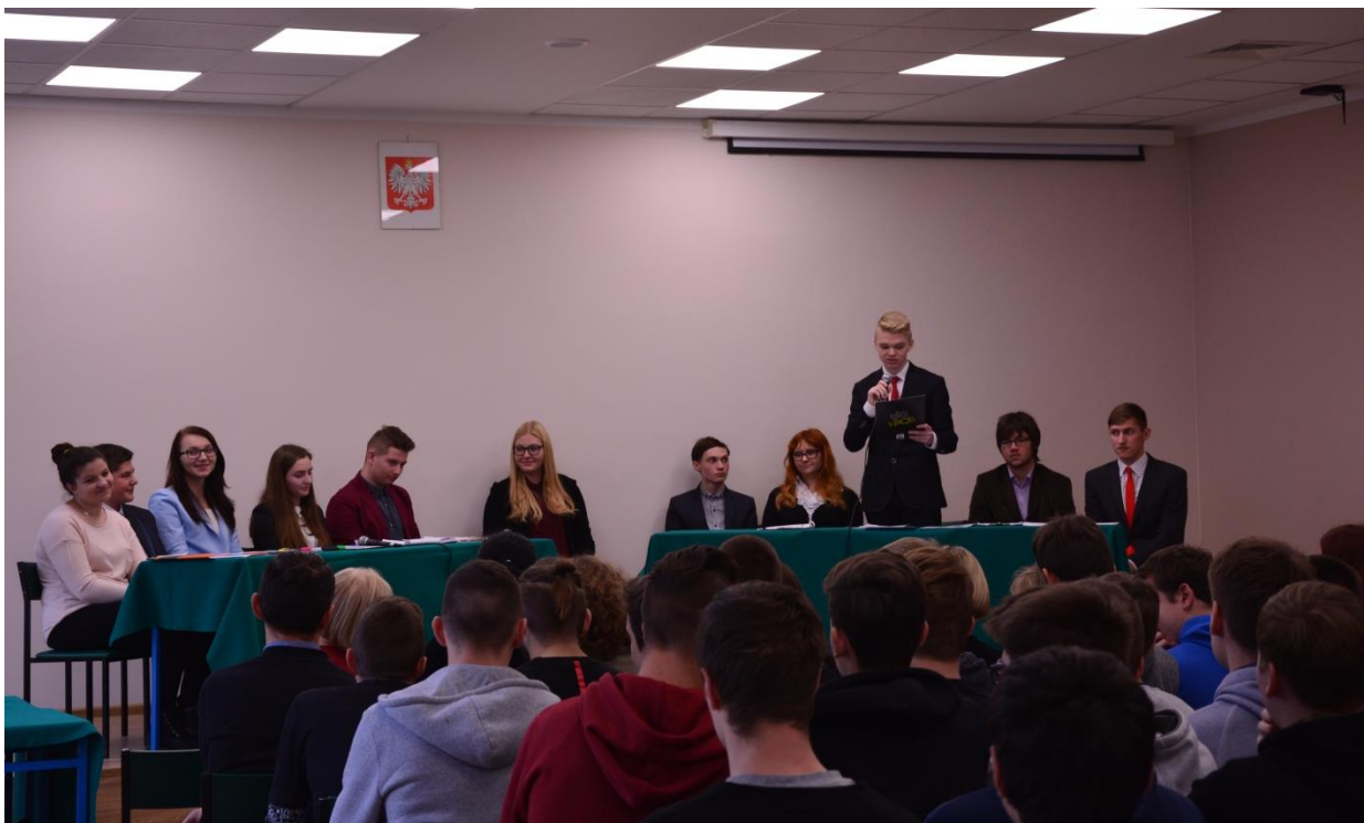
Debata szkolna na temat przestrzegania praw dziecka