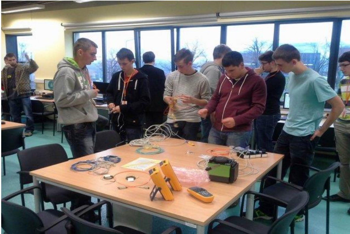
Praktyki zawodowe uczniów klasy trzeciej technikum kształcącego w zawodzie technik informatyk zorganizowane przez Politechnikę Poznańską