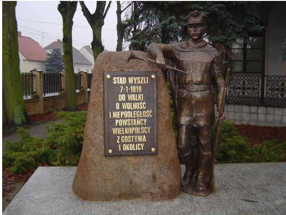
Obelisk upamiętniający wymarsz gostyńskiego batalionu na front powstańczy przed budynkiem Szkoły Muzycznej (dawnej Strzelnicy) przy ul. Strzeleckiej w Gostyniu