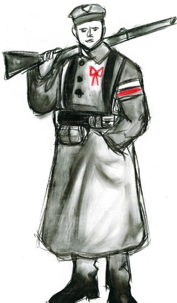
(rys. Weronika Wawrzyniak)