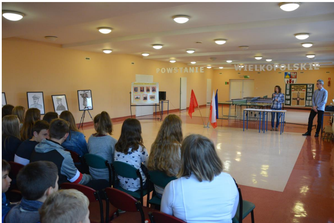
Rozpoczęcie gry miejskiej w budynku szkoły przy ul. Poznańskiej.