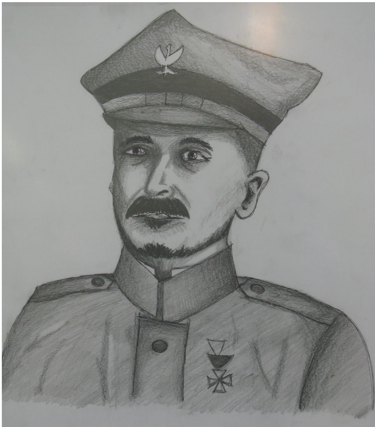
JÓZEF DOWBOR MUŚNICKI