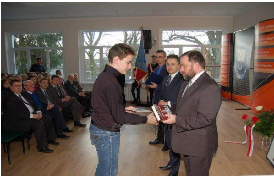
Wręczenie nagród zwycięzcom Powiatowego Konkursu Wiedzy o Powstaniu Wielkopolskim – 5 stycznia 2017 r.