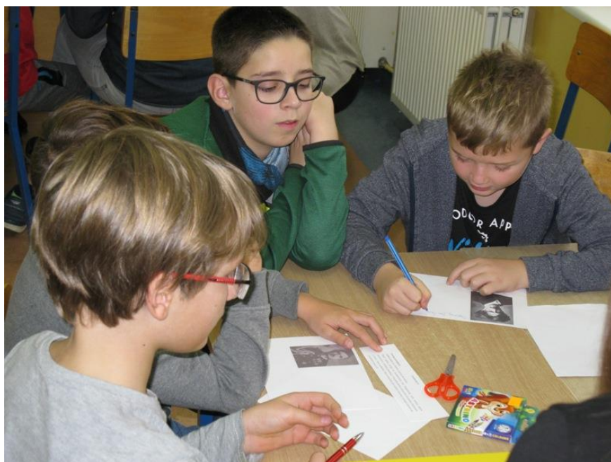
Uczniowie SP nr 5 rozwiązują zadania.