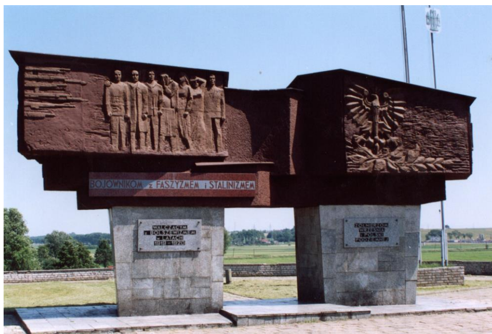
Pomnik Bohaterów Ziemi Gostyńskiej usytuowany na Górze Zamkowej, wzniesiony ku czci wszystkich poległych w walkach o niepodległą Ojczyznę oraz ofiar minionych wojen i powstań, w których walczyli i ginęli gostynianie. Pomnik odsłonięto 22 lipca 1974 roku. Ufundowało go społeczeństwo ziemi gostyńskiej.