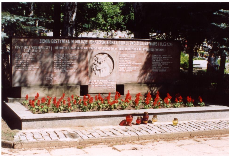
Pomnik „ W hołdzie bohaterom, którzy oddali swe życie za Wiarę i Ojczyznę ”. Wzniesiono go na gostyńskim cmentarzu na grobie 30 rozstrzelanych mieszkańców Gostynia i okolicy w 1939 roku. Przeniesiono do niego prochy 9 Powstańców Wielkopolskich.