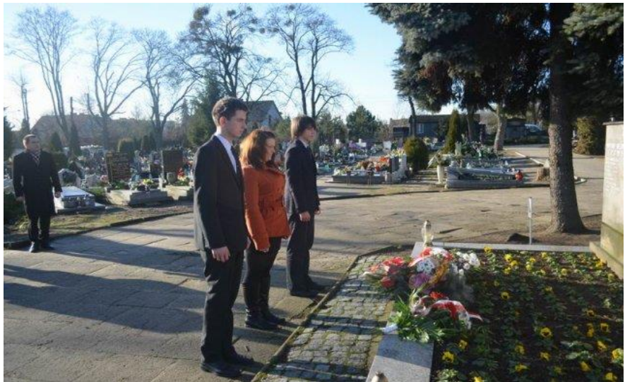
Składanie kwiatów na gostyńskim cmentarzu – 7 stycznia 2014 r.

W roku 2013 Zespół Szkół Zawodowych w Gostyniu przystąpił do wspólnej realizacji projektu edukacyjnego „Młodzież na tropach przeszłości” – gry miejskie w Śremie, Koźminie i Gostyniu śladami powstańców wielkopolskich w 95 rocznicę wybuchu. Jego głównym organizatorem było Stowarzyszenie WARTO oraz Zespół Szkół Politechnicznych w Śremie. To co łączy nasze szkoły, to wspólny patron – Powstańcy Wielkopolscy. Uczniowie w Śremie, Koźminie i Gostyniu, obchodząc co roku dzień patrona, poznają historię związaną z Powstaniem Wielkopolskim, wędrują śladami tego ważnego wydarzenia. Projekt współfinansowany był przez Urząd Marszałkowski Województwa Wielkopolskiego i realizowany od 15 maja 2013 do 20 listopada 2013 roku. Realizacja tegorocznego projektu „Powstanie Wielkopolskie w pamięci młodego pokolenia” związana jest z obchodami 100 rocznicy wybuchu Powstania Wielkopolskiego.