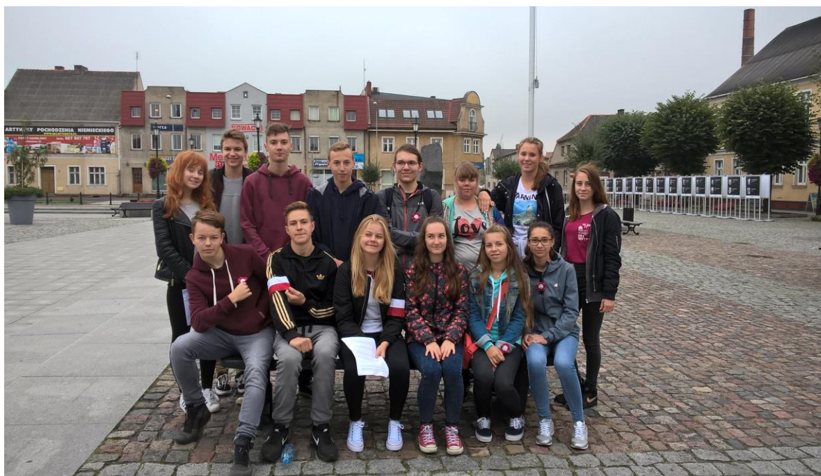
Uczniowie klasy 1 TE na gostyńskim rynku.