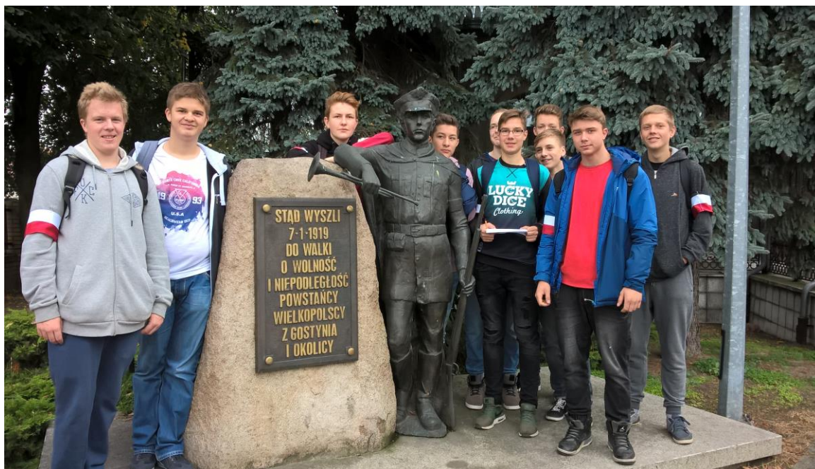
Uczniowie klasy 1 TA przy pomniku Powstańców Wielkopolskich przy ul. Strzeleckiej.